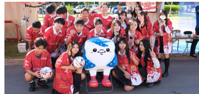
ミッション型探求授業

小学生以下子ども達は、ホームゲーム全試合を無料で観戦可能。ホームタウンの子ども達が地元のプロサッカー選手や試合に触れることで夢や感動を得られる機会を提供することに賛同いただく企業のご支援で運用しております。