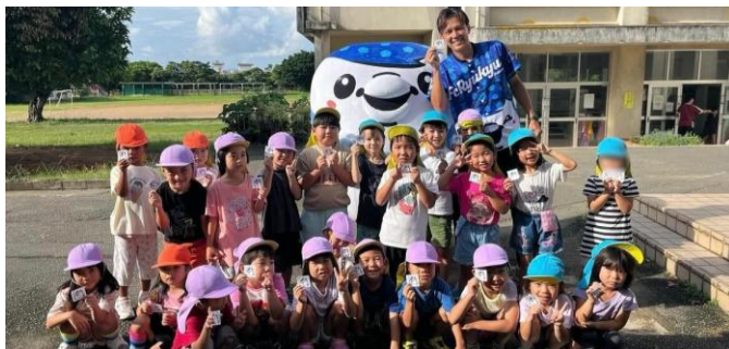
ゆいゆいSMILEプロジェクト

FC琉球やFC琉球さくらの選手、スタッフがホームタウンの小学生、中学生、高校生を対象に、将来の夢ややりたい職業を考えるきっかけとなる講話を実施したり、体育の授業への参加、挨拶運動学校訪問活動を行っています。