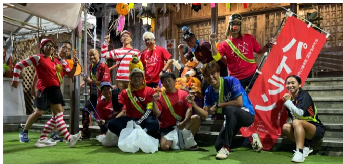
ゆいまーるパトロール

沖縄県内の高校生とFC琉球が連携し、ミッション型探求授業に挑戦します。本取り組みは、FC琉球のフロントスタッフとともに学びながら、課題解決に向けたさまざまな企画の立案から準備、実施・運営までを実践的に行う授業です。