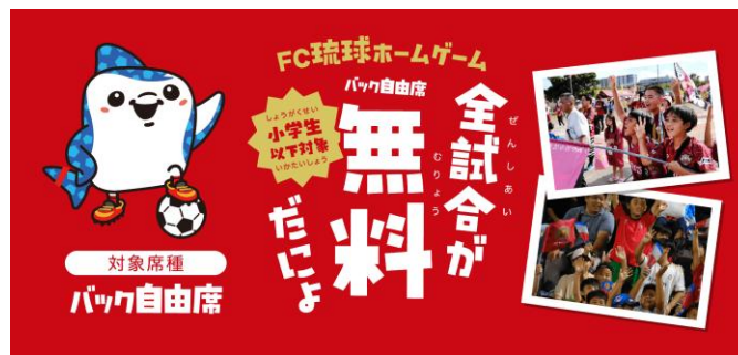
キッズフリーパス

FC琉球やFC琉球さくらの選手、スタッフがホームタウンの小学生、中学生、高校生を対象に、将来の夢ややりたい職業を考えるきっかけとなる講話を実施したり、体育の授業への参加、挨拶運動学校訪問活動を行っています。